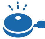
ベル・リフレクタ